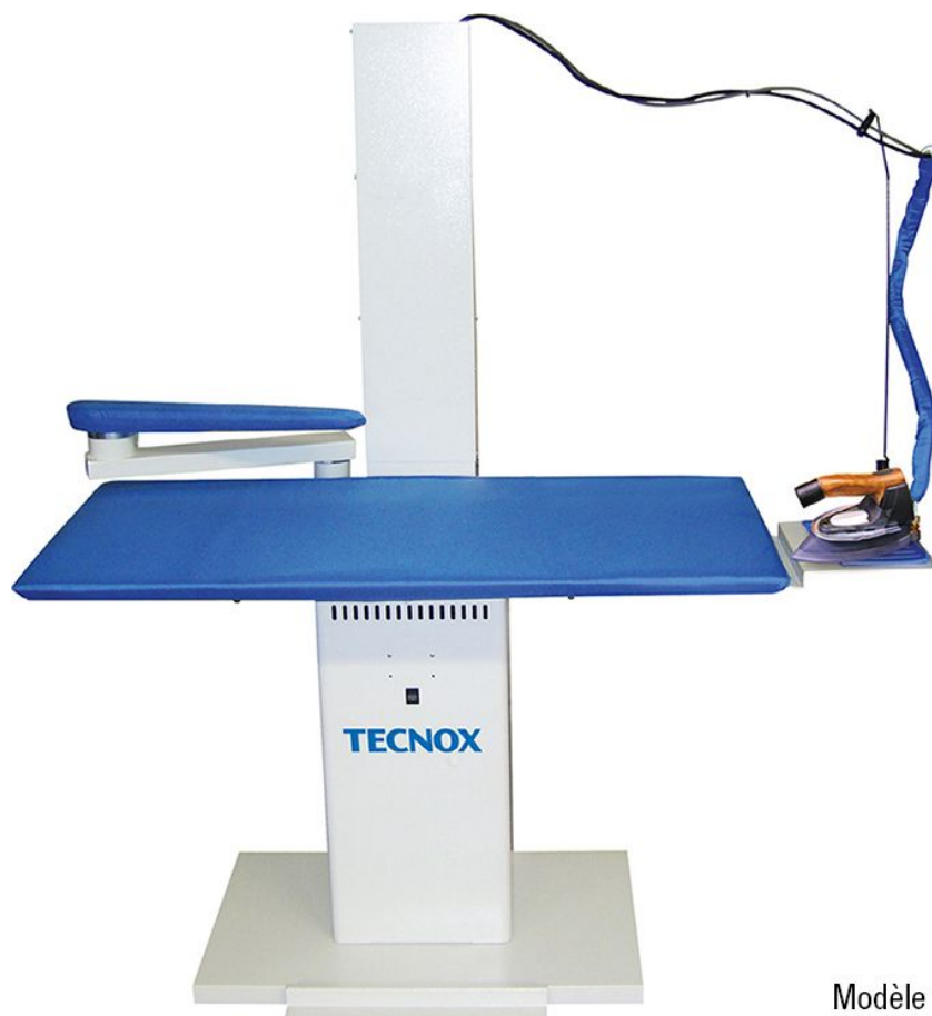
Modèle 1980 AI présenté avec accessoires