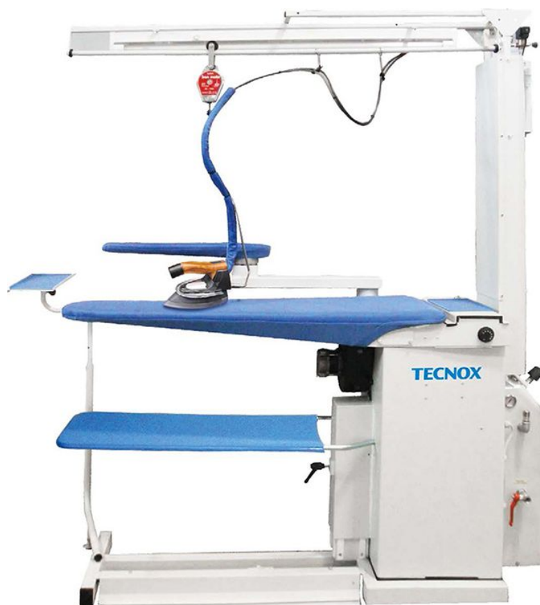
Table de repassage aspirante/chauffante/soufflantes, réseau vapeur