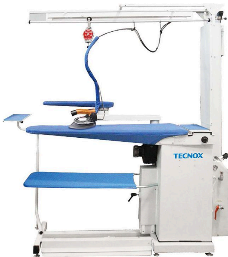
Table de repassage aspirante/chauffante, réseau vapeur