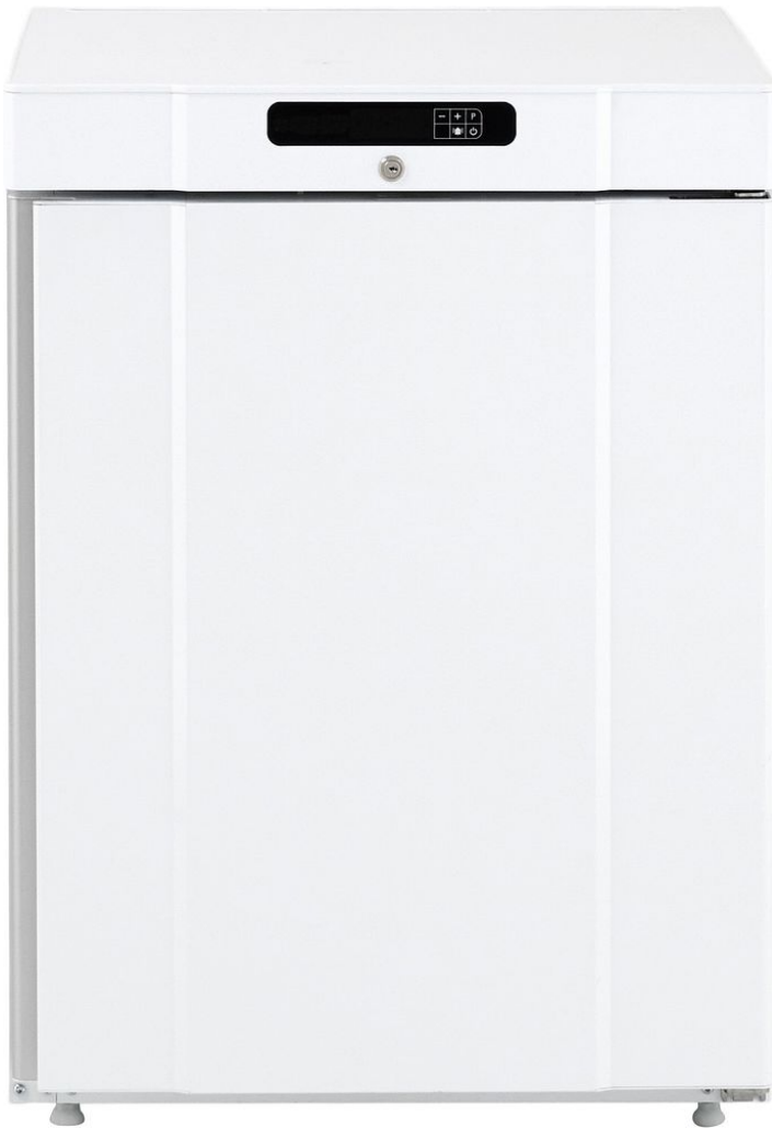
TABLE TOP NEG. BLANC