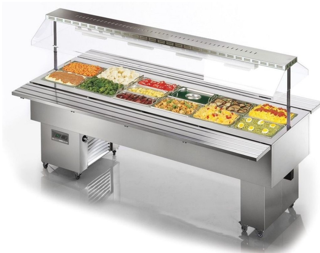
Version présentée : Isola 6 BM inox