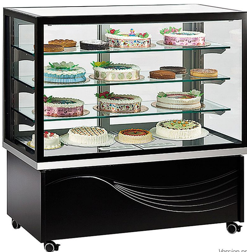
Version présentée Karina 136