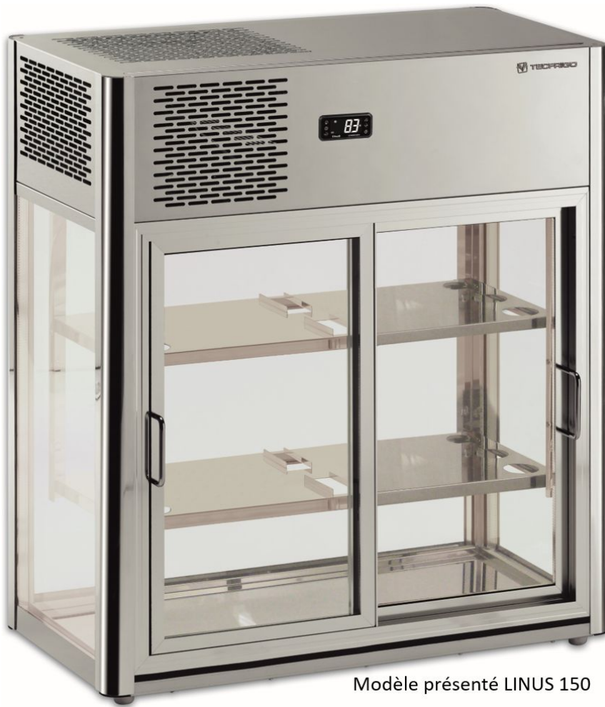
Modèle présenté LINUS 150