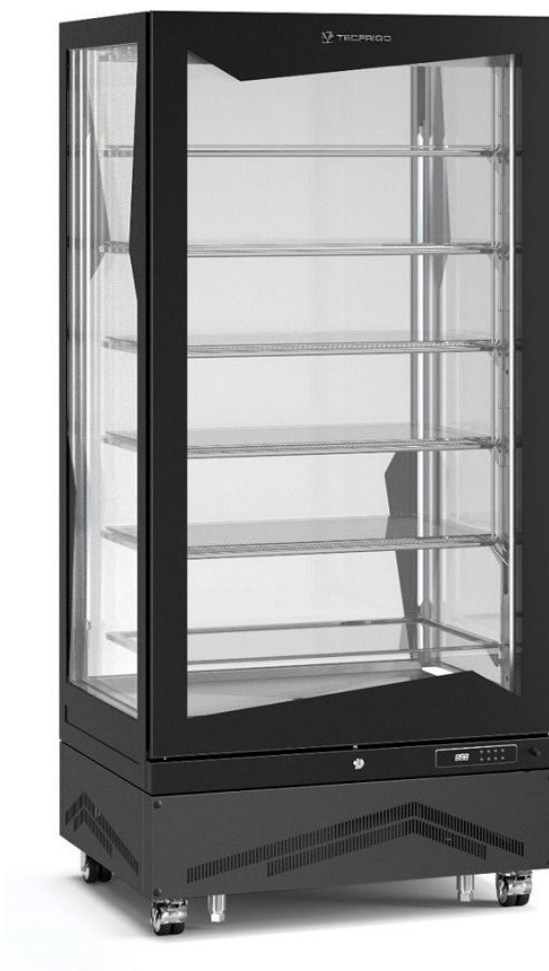
Version présentée Marilyn 650 GBT