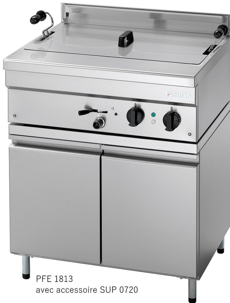
PFE 1813 avec accessoire SUP 0720