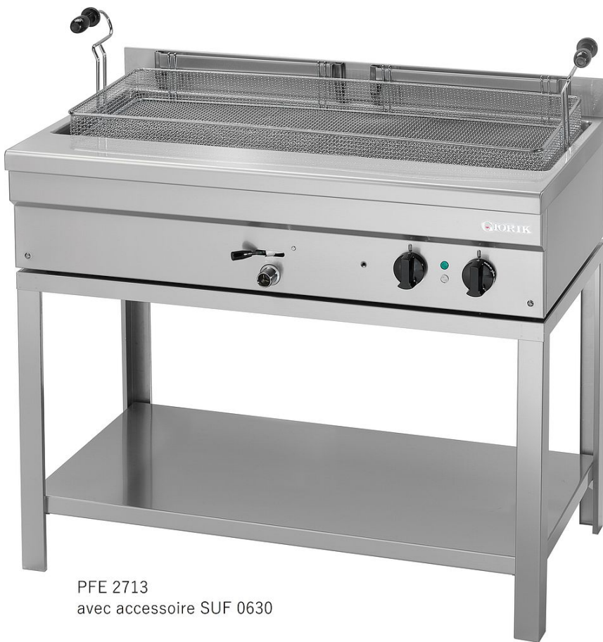
PFE 2713 avec accessoire SUF 0630