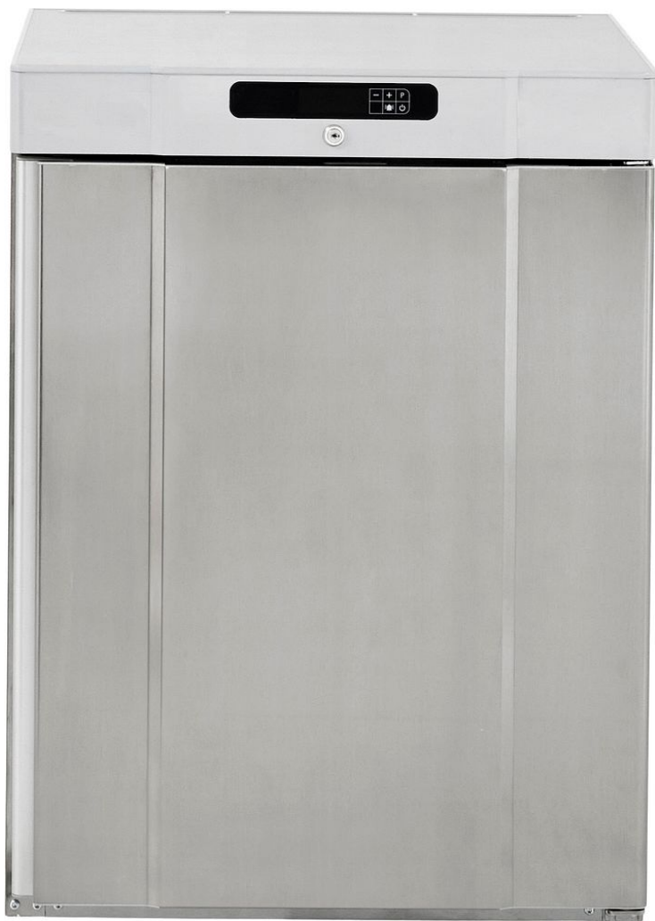
TABLE TOP POSITIF INOX 125 L