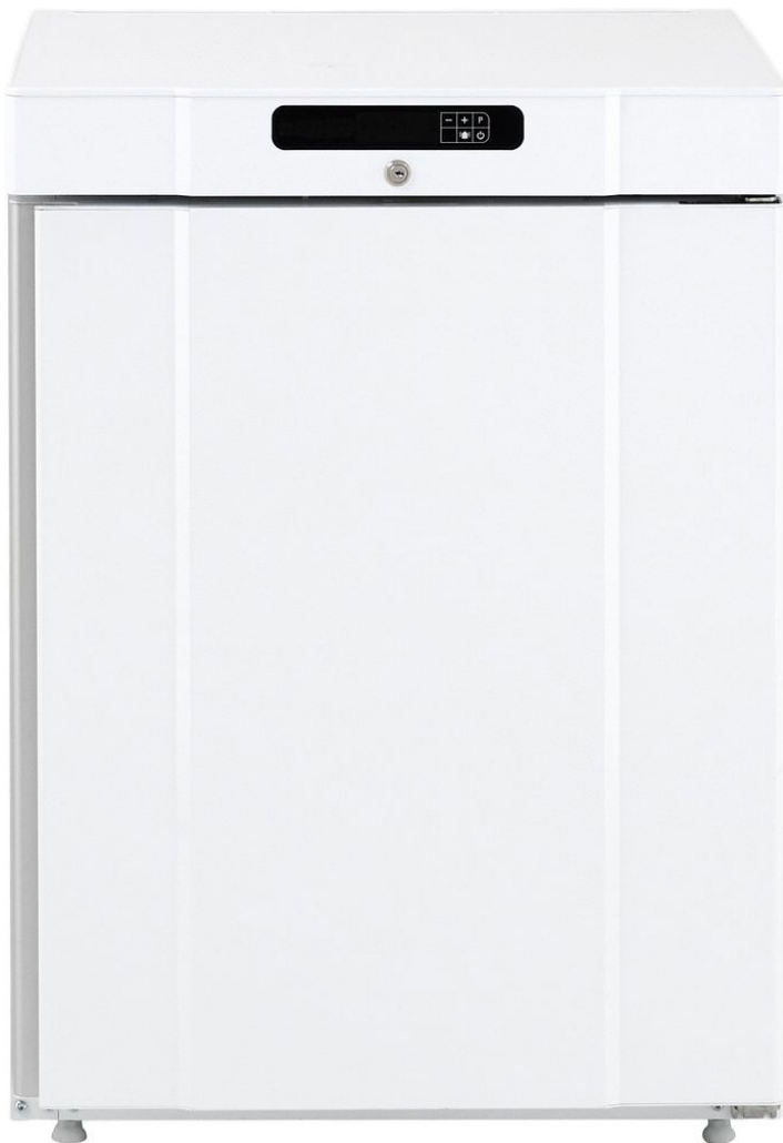
TABLE TOP POSITIF BLANC 125 L